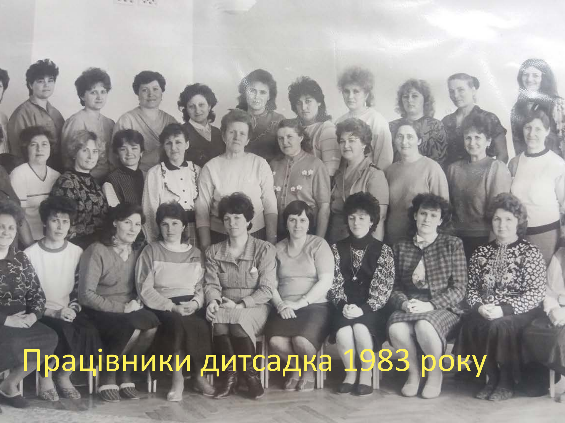
Працівники дитсадка 1983 року