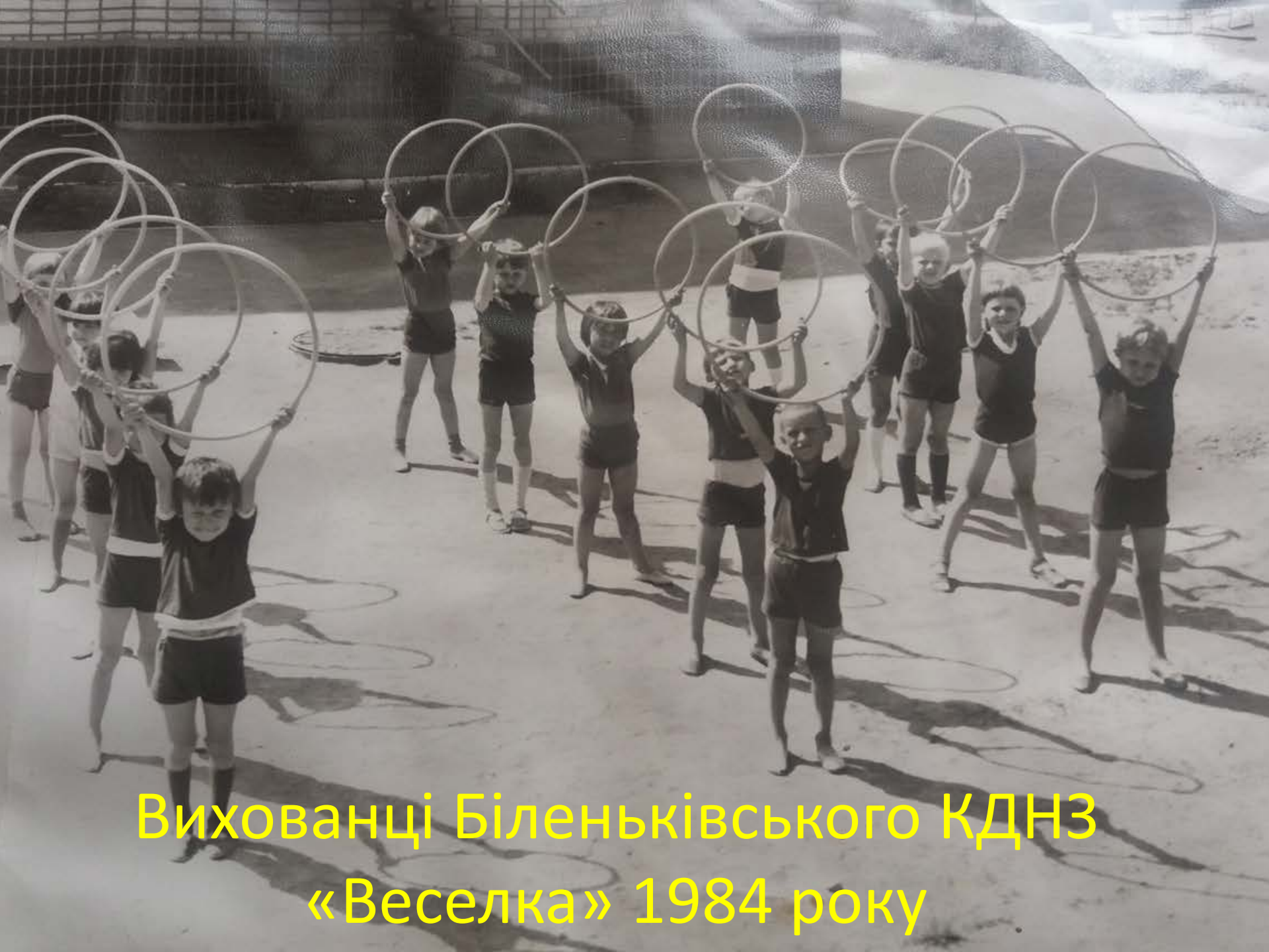
Вихованці Біленьківського КДНЗ «Веселка» 1984 року